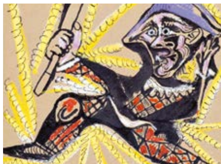
Pablo Picasso, Arlequin , 14 janvier 1971 (II). Don de l'artiste en 1971. Collection Musée Réattu, Arles. © Succession Picasso 2026

Sans réservation - rendez-vous dans la cour pour y participer.