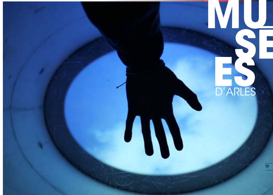
© Lee Ufan Arles / Adagp 2025